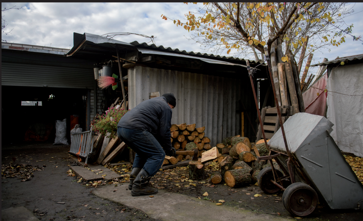
↑ Літній чоловік рубає дрова, тому що в його домі немає електропостачання чи опалення на Харківщині, Україна