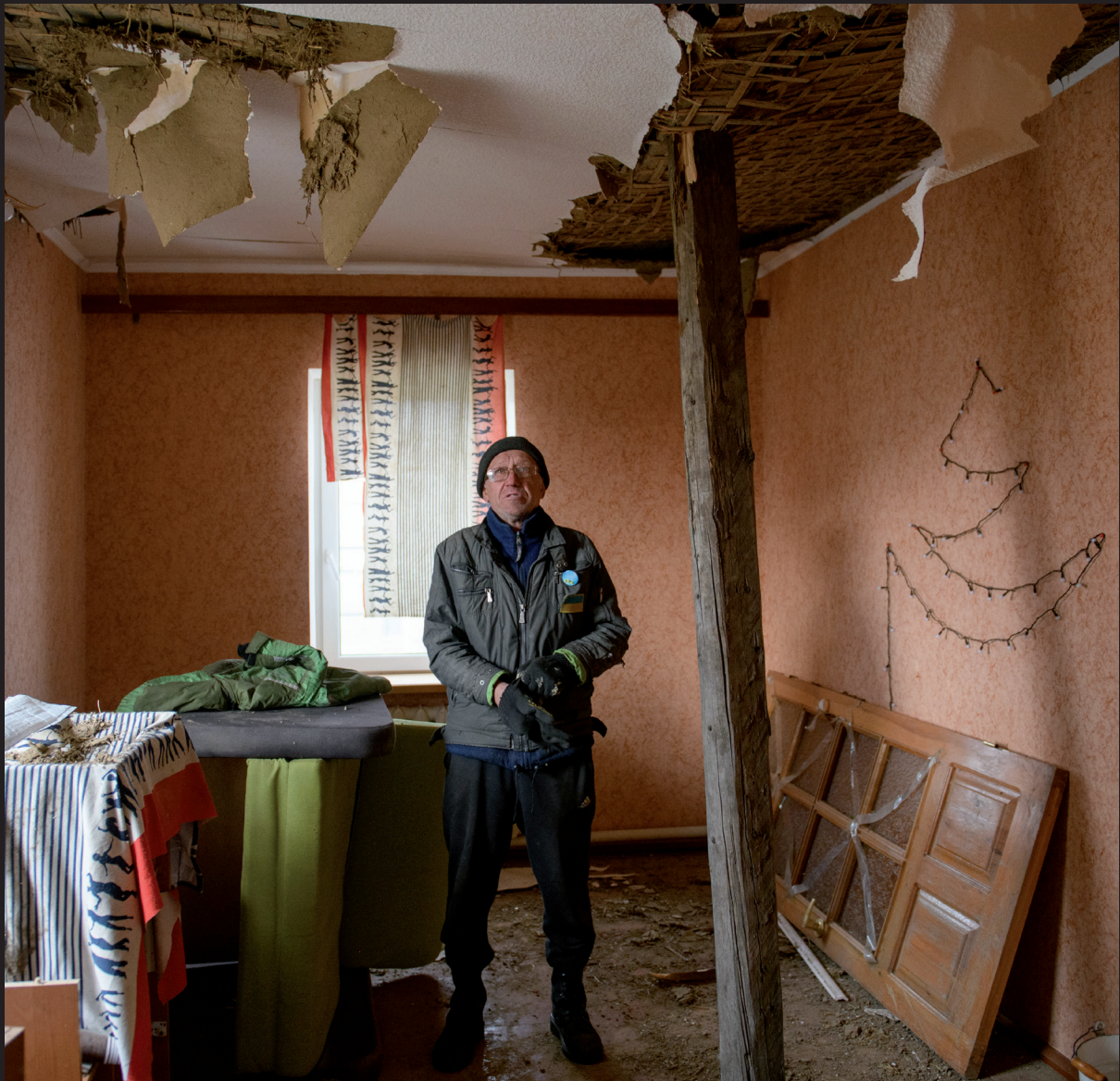
↑ Літній чоловік у своєму домі, що зазнав пошкоджень від обстрілів на Харківщині, Україна