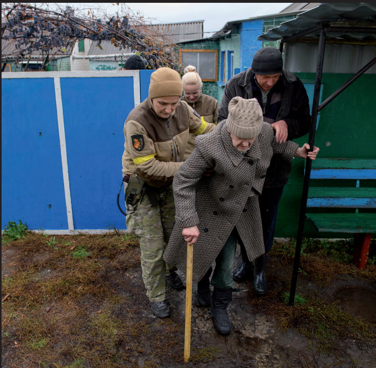
↑ Евакуація літньої жінки з інвалідністю на Харківщині, Україна