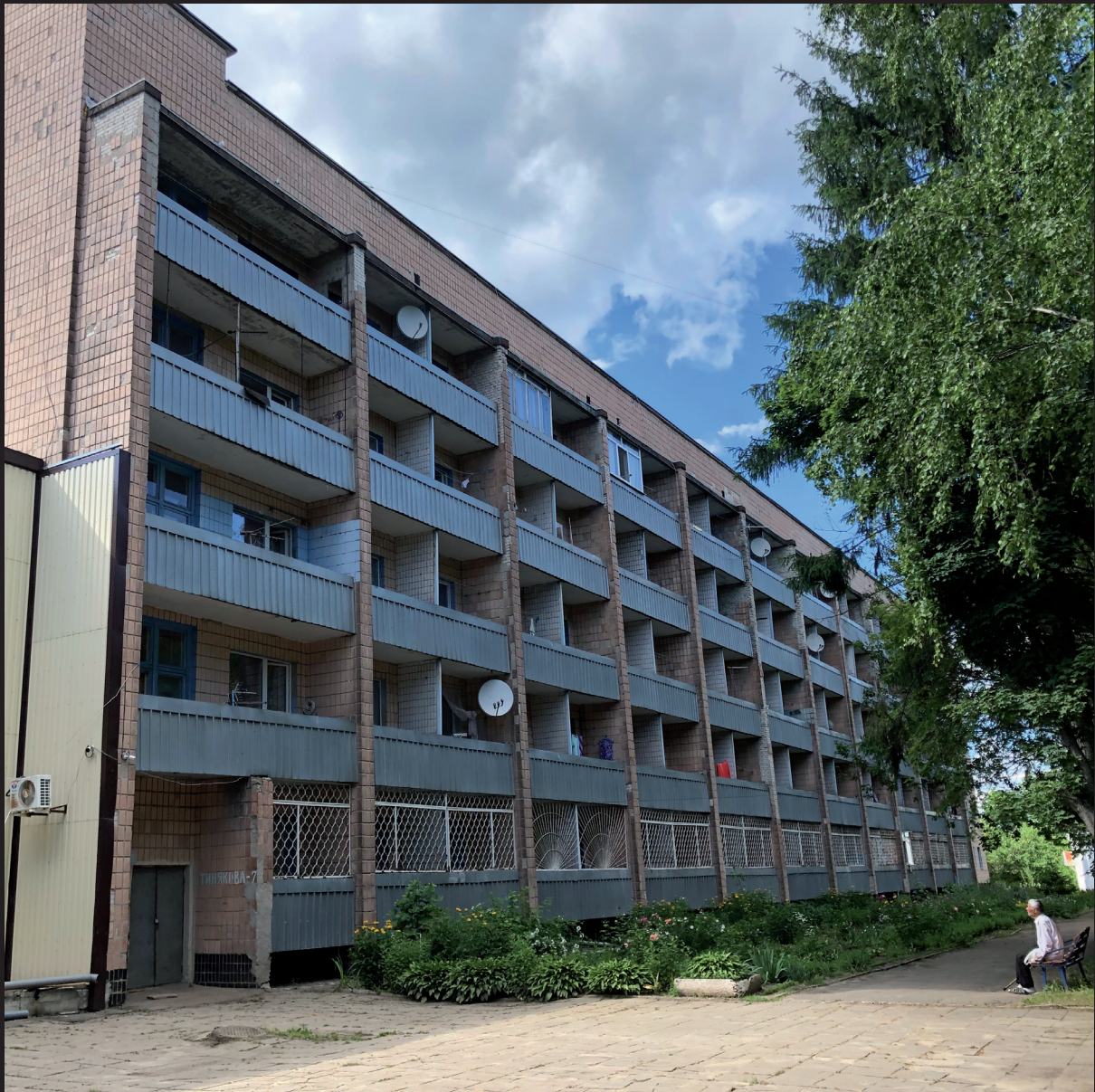
↑ Установа для людей похилого віку в Україні