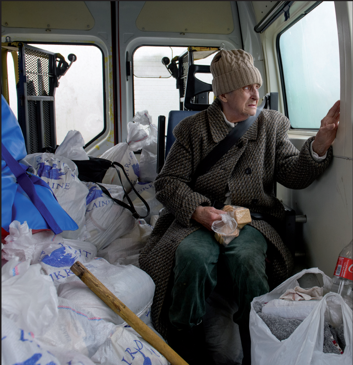
↑ Евакуація літньої жінки з інвалідністю на Харківщині, Україна