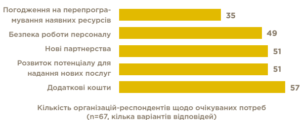
ТАБ. 7. ОЧІКУВАНІ ПОТРЕБИ В НИЙБЛИЖЧІ 3 МІСЯЦІ

«Існує критична нестача фінансування для допомоги вразливим групам жінок!» – Представник/ця місцевої ОГС