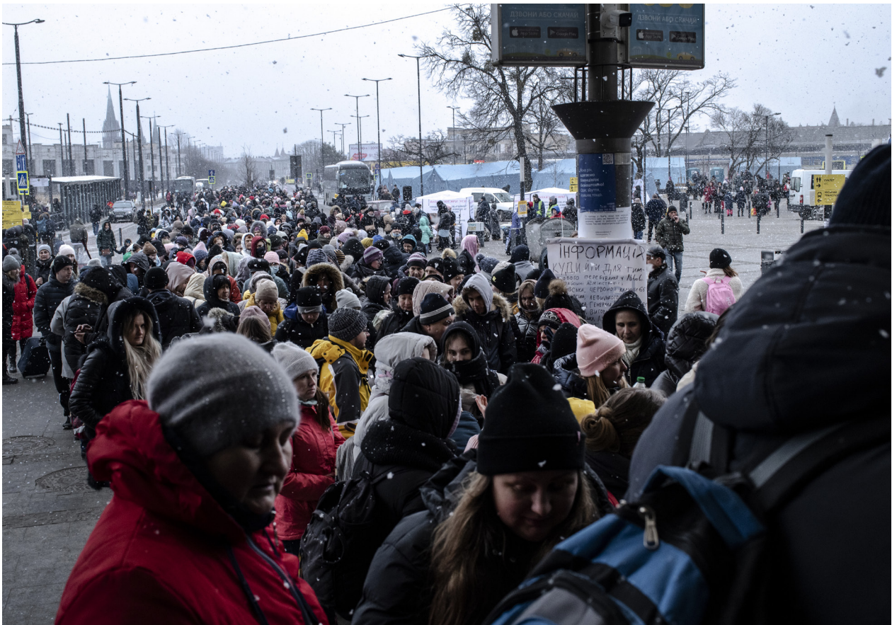
Допомога українцям у Львові, березень 2022 р.

«Зараз робота поліції переорієнтована, тому випадки гендерно-зумовленого насильства залишаються поза увагою». – Представник/ця місцевої ОГС