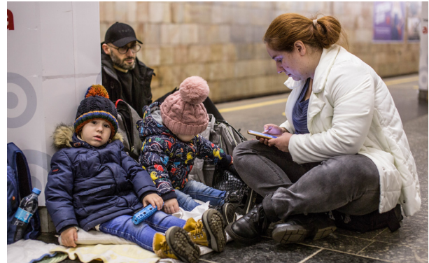
Сім'я у пошуках притулку в київському метрополітені.

«Крім гуманітарних потреб та безпечного місця перебування, жінкам потрібна інформаційна та юридична підтримка, така як реєстрація народження, перетин кордону, статус біженця чи тимчасовий притулок, захист від домашнього насильства,