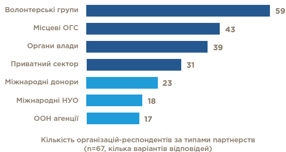
ТАБ. 6. ПОТОЧНІ ПАРТНЕРСТВА ОГС