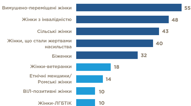
ТАБ. 3. КІЛЬКІСТЬ ОГС, ЩО ПРАЦЮЮТЬ З РІЗНИМИ КАТЕГОРІЯМИ ВРАЗЛИВИХ ЖІНОК

Кількість організацій-респондентів, які працюють із вразливими групами жінок (n=67, кілька варіантів відповідей)