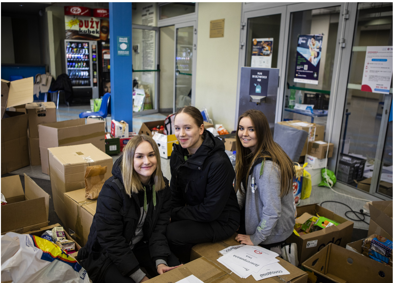
Волонтерський пункт допомоги біженцям з України - Польща, березень 2022 р.

Щоб отримати більше інформації про жіночі організації громадянського суспільства в Україні, які діють під час кризи спричиненої війною, та про те як ви можете їх підтримати, зв'яжіться з нами unwomen.ukraine@unwomen.org