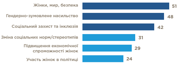
ТАБ. 2. КІЛЬКІСТЬ ОГС, ЩО ПРАЦЮЮТЬ ЗА РІЗНИМИ ТЕМАТИЧНИМИ НАПРЯМКАМИ

Кількість організацій-респондентів за тематичними напрямками втручання (n=67, кілька варіантів відповідей)