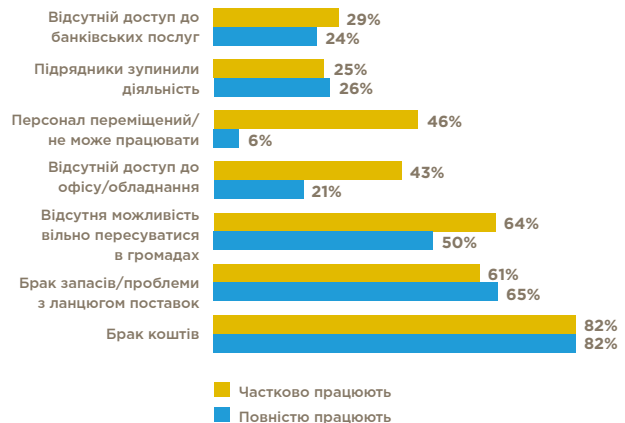
ТАБ. 4. КЛЮЧОВІ ПРОБЛЕМИ, З ЯКИМИ СТИКАЮТЬСЯ ОГС В ПЕРІОД КРИЗИ

Відсоток організацій-респондентів, які повністю або частково працюють (n=62, кілька варіантів відповідей)