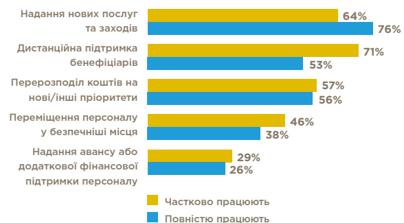
ТАБ. 5. КОРЕКТИВИ, ВНЕСЕНІ ОГС У ВІДПОВІДЬ НА КРИЗУ, ВИКЛИКАНУ ВІЙНОЮ

Відсоток організацій-респондентів, які повністю або частково працюють (n=62, кілька варіантів відповідей)