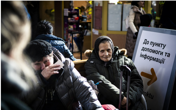
Українські біженці/ки на залізничному вокзалі Жешув у Польщі, березень 2022 року / ВООЗ

«При пересуванні через кордон існує ризик бути залученим до сексуального рабства». – Представник/ця місцевої ОГС