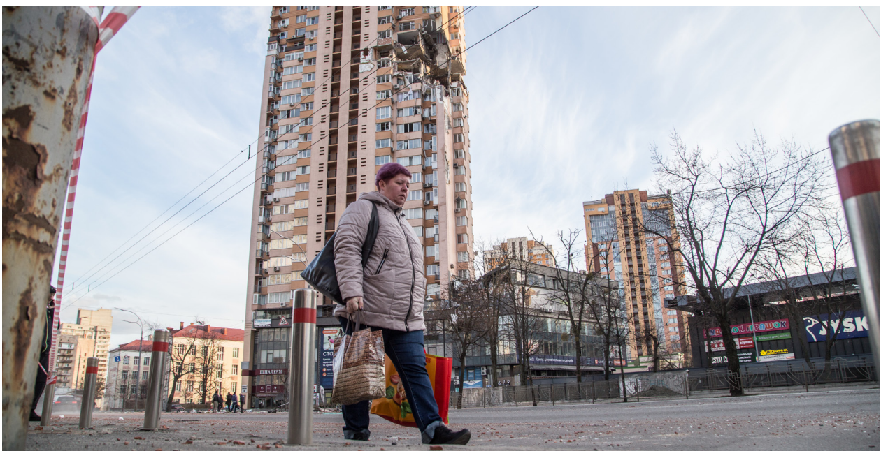
Вул. Лобановського 6а, Київ 25 лютого 2022.

«Війна, що почалася 24 лютого 2022 року, вкотре показала, наскільки жінки ігноруються на рівні координації та прийняття рішень. Їхні пропозиції та потреби ігноруються, а натомість пріоритет надається потребам Тераоборони (добровільна місцева оборонна група), що представлена переважно чоловіками. У той же час, коли йдеться про гуманітарні потреби ВПО, місцевих жителів та домогосподарств – більшість роботи виконують жінки – вони їздять, забезпечують лікарні та місцевих жителів ліками та їжею, піклуються про своїх непрацездатних родичів та дітей. І все це знову і знову залишається непоміченим». – Представник/ця місцевої ОГС